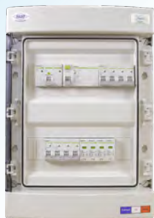
Coffret AC pour application photovoltaïque