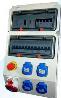
Coffrets de chantier