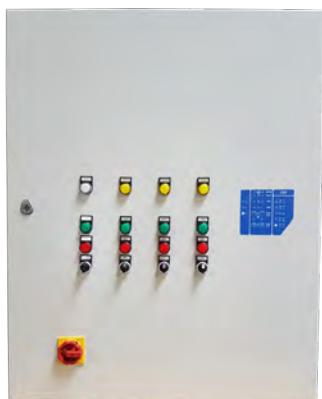
Coffret pour application de pompage