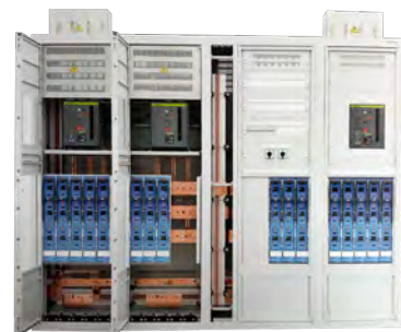
TGBT AC 400 ou 800V jusqu'à plus de 2500A