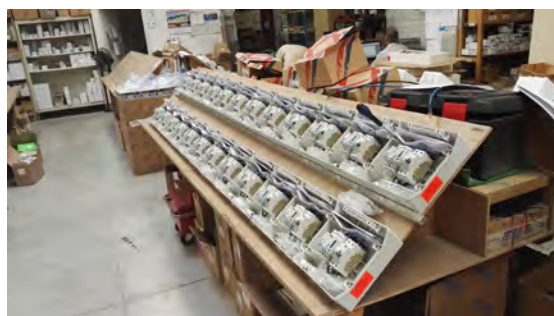
Exemples de fabrication dans notre atelier.

Avec nos fabrications de coffrets nous avons fourni plus de 200MWc d'installations PV en moins de 7 ans, soit 4% du parc France (dont 15% des installations PV < 3kWc).