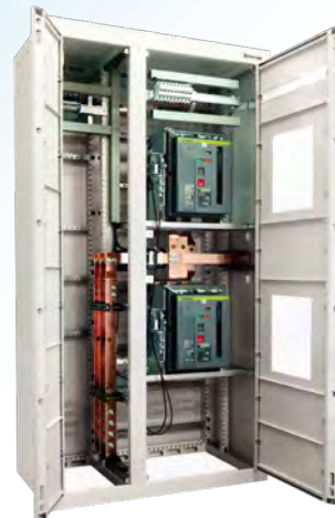
TGBT de forte puissance