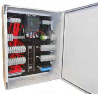
Boîte de jonction multi strings