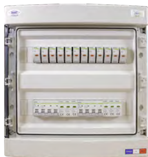
Coffret DC pour application photovoltaïque