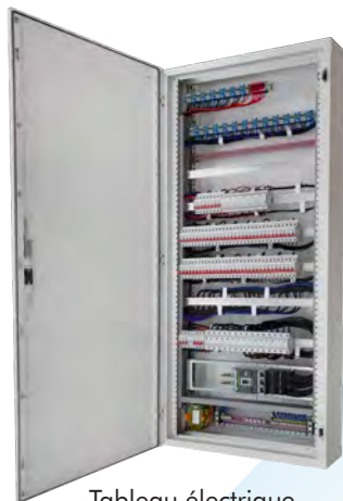
Tableau électrique pour le tertiaire